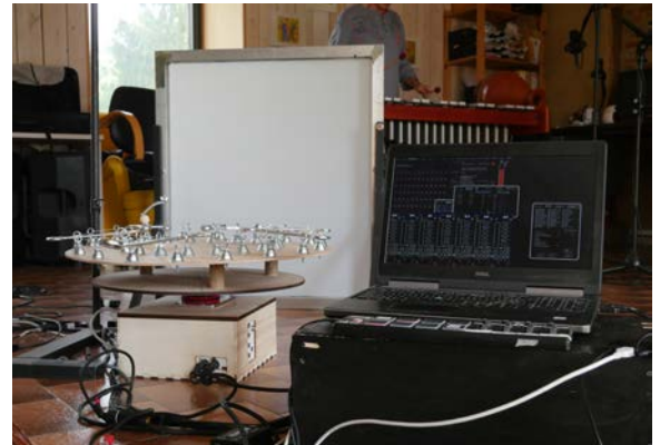
Dispositif des lanternes à musique contrôlé par ordinateur